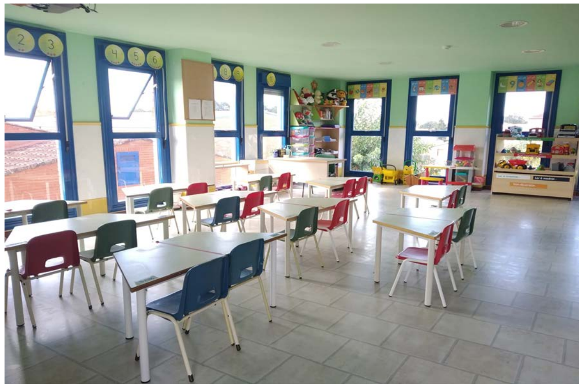
AULA 5º A